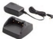
VAC-50A ※1 急速充電器 標準型充電池を約130分で充電