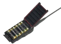
FBA-34 ※2 アルカリ単3乾電池ケース (防水) 乾電池 6本使用