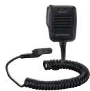
MH-66A7A 防水スピーカーマイク 防滴構造 3.5φイヤホンジャック付