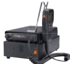
FP-33 指令局用直流安定化電源 デスクトップで指令局として 使用する際の電源装置。 大型スピーカー内蔵