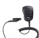
MH-83A7A スピーカーマイク しっかりとしたホールド感。 3.5φイヤホンジャック付