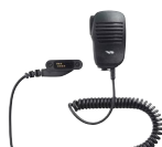
MH-82A7A コンパクトスピーカーマイク 小型で自然な装着感。 3.5φイヤホンジャック付