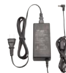
PA-47A 連結型充電器用ACアダプタ