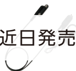
EK-515W-460 タイプインマイク & イヤホン