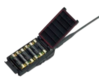
FBA-34 *2 アルカリ単3乾電池ケース (防水) 乾電池 6 本使用