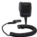
MH-66A7A 防水スピーカーマイク 防滴構造 3.5φイヤホンジャック付