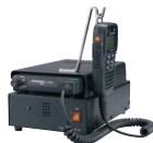
FP-33 指令局用直流安定化電源 デスクトップで指令局として 使用する際の電源装置。 大型スピーカー内蔵